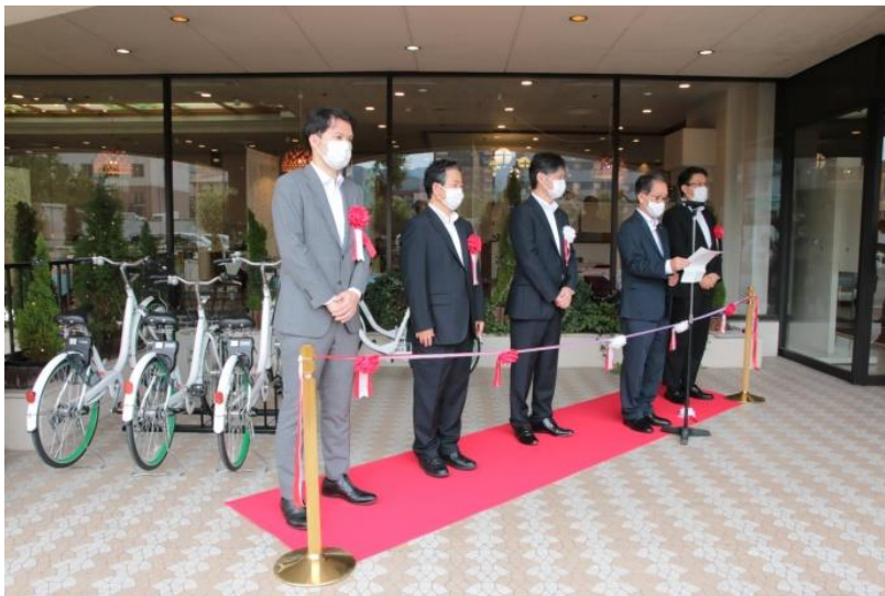
2020年9月4日に山口市で行われたスタートアップセレモニーの様子

山口市シェアサイクル実証事業は、山口市内の公共交通を補完し、新たな移動手段の役割を担うとともに、山口市で開催される「山口ゆめ回廊博覧会」をはじめとした観光客や市民の生活における移動手段として、短距離移動の利便性及び市内における回遊性の向上を目的としています。