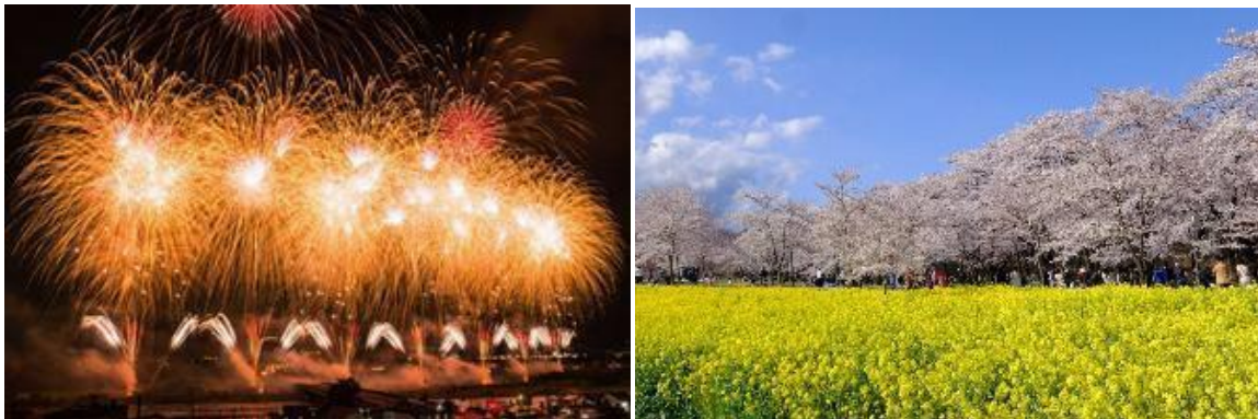
※左から、前橋花火大会、赤城南面千本桜の様子

群馬県前橋市(以下前橋市)と ecobike 株式会社(以下 ecobike 社)は、2021年4月から前橋市においてシェアサイクル事業を開始いたしますのでお知らせします。これにより、観光資源が適度な距離で点在する前橋市の観光地を巡る交通手段として、また市民やビジネスパーソンの二次交通としてシェアサイクルの本格導入に向けて取り組んでまいります。