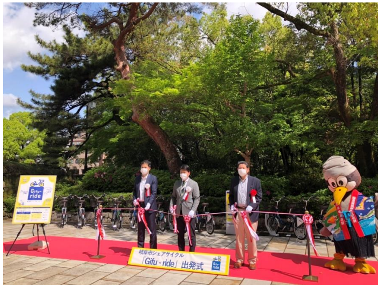
※4月22日に行われた出発式の様子

ecobike 株式会社(以下 ecobike 社)は、2022年4月22日(金)から岐阜県岐阜市(以下岐阜市)においてシェアサイクル(Gifu-ride)サービスを開始しましたのでお知らせします。観光客や岐阜市民のあらたな二次交通として、シェアサイクルをご利用いただけるよう取り組んでまいります。