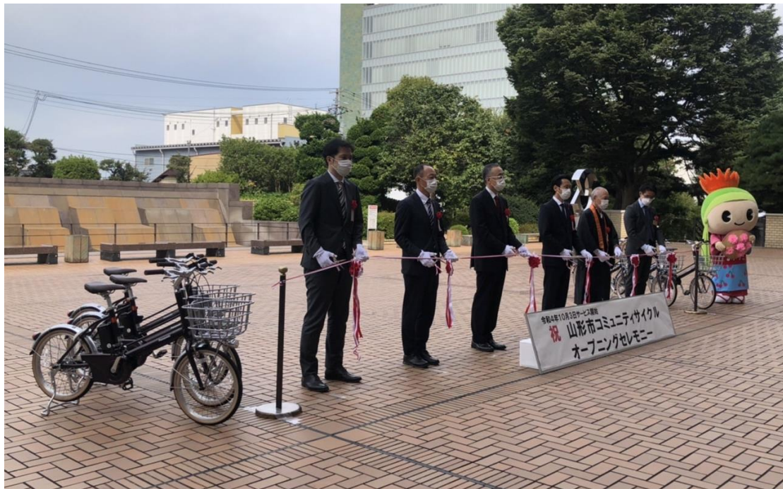
※2022年10月3日に行われた出発式の様子

ecobike 株式会社(以下 ecobike 社)は、2022年10月3日から山形県山形市(以下山形市)において「山形市コミュニティサイクル」のサービスを開始したことをお知らせします。